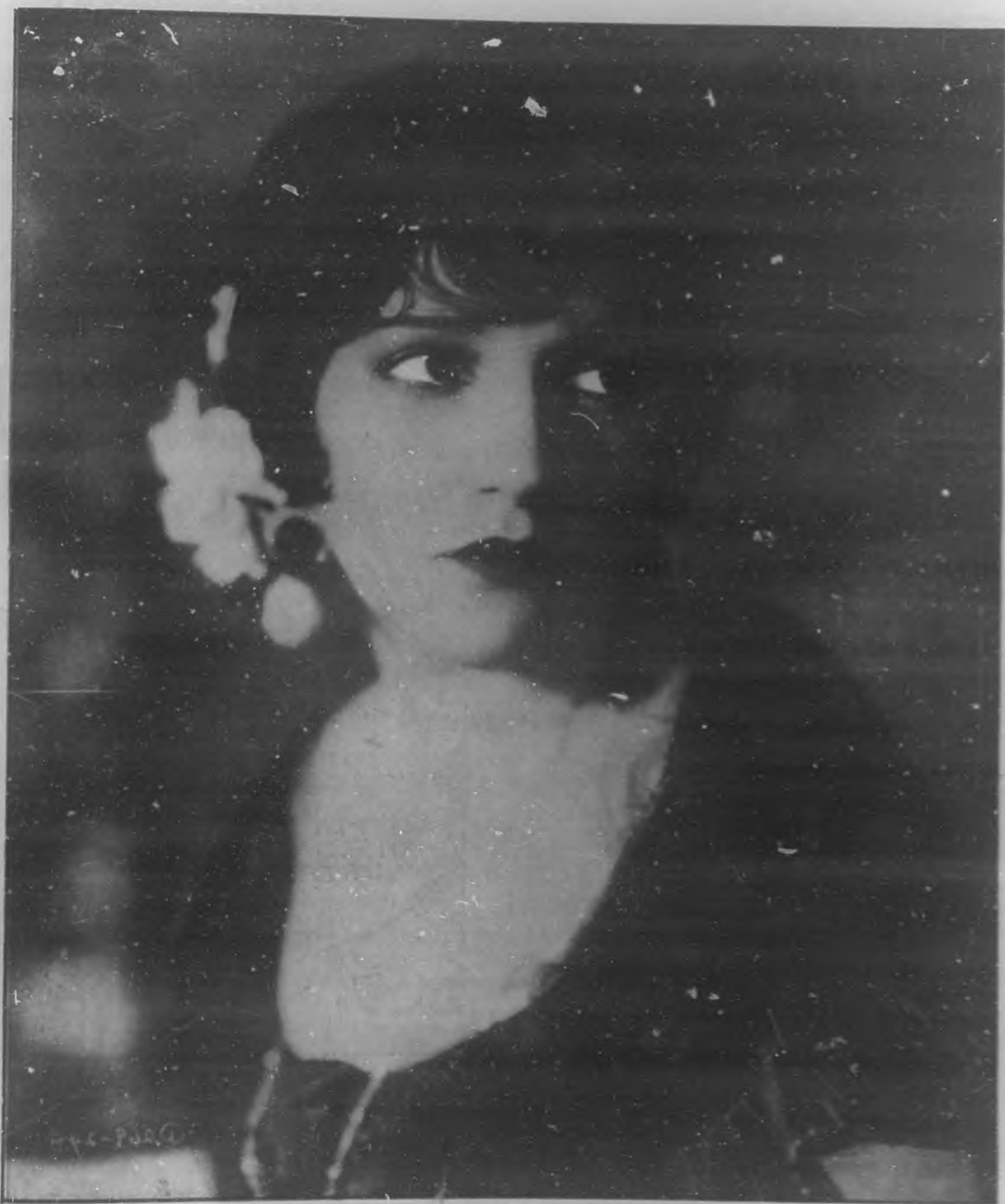
BEBE DANIELS Bella actriz de la "Paramount Pictures".