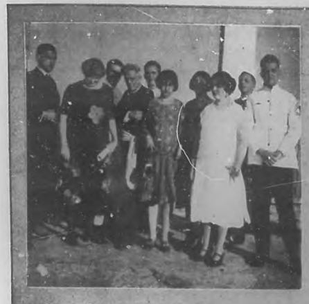
Los miembros componentes de la Sección de Declamación del Preidido Nacional, que recientemente tomaron parte en una veada aérea en honor de la Logia "América". Este acto resultó muy brillante y concurrido, obteniendo los aficionados que en él tomaron parte merecidos aplausos.